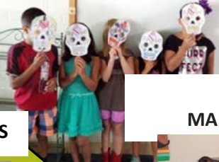
PROGRAMA DE MAESTRO BI-NACIONAL