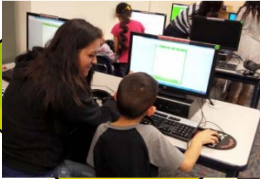
APOYO DE TUTORIA