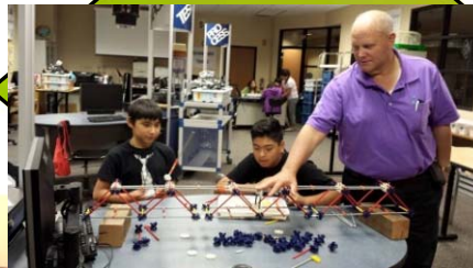
(STEM) CAMPAMENTOS CIENTÍFICOS